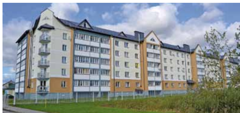
Вясковае забудова змяняецца шматпавярховікамі.