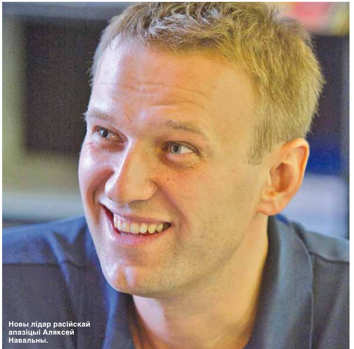
Новы лідар расійскай апазіцыі Аляксей Навальны.

Першае месца ў агульнаграмадзянскім спісе з 43 тысячамі галасоў заняў Аляксей Навальны —