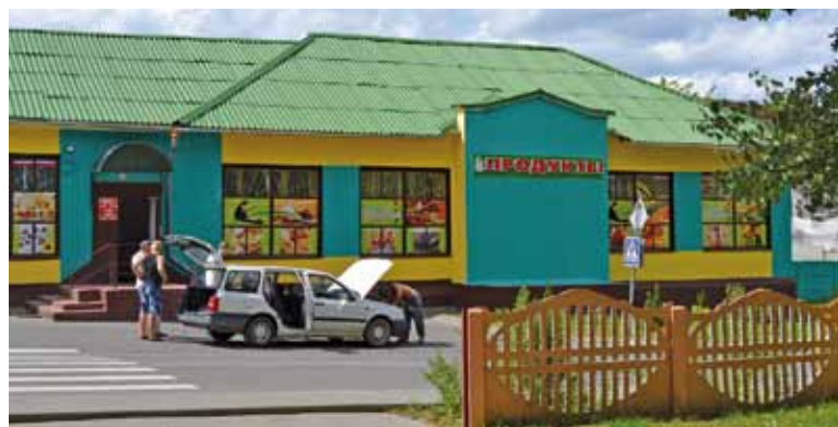
Тры (!) крамы на адлегласці выцягнутай рукі адна ад адной. Да школы ад іх 100 метраў.

Што да аховы здароўя, то да рэканструкцыі школы галоўным сацыяльным аб'ектам мя-