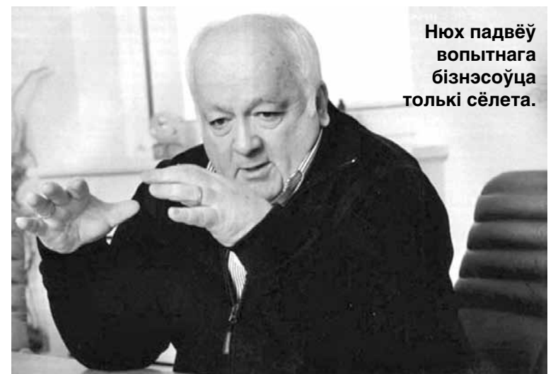
Нюх падвёў вопытнага бізнэсоўца толькі сёлета.

Старыя сувязі і прадпрымальніцкая жылка дазволілі яму стварыць бізнэс і ў эміграцыі. Пачатак 1990-х стаў новым зорным часам для бізнэсмэна. Па ягоных словах, на той час ён займаўся прадпрымальніцтвам з расійскімі партнёрамі, аднак у 1993 годзе да яго звярнуліся тагачасныя кіраўнікі «Спартак» з просьбай аб дапамозе. Новікаў узяўся за справу. Услед за гомельскай кандытарскай фабрыкай ён неўзабаве атрымаў і долю ў мінскай «Камунарцы». За