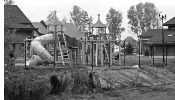
Побач з рэстаранам будзе дзіцячая пляцоўка з відам на некропаль.