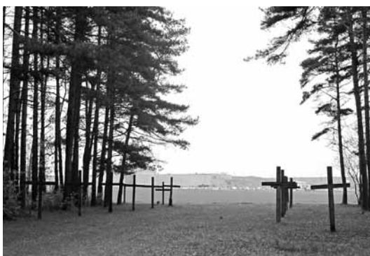
Пахаванні былі адкрыты ў канцы 1980-х. З чых часоў лес ператварыўся ў Крыжовую Гару.