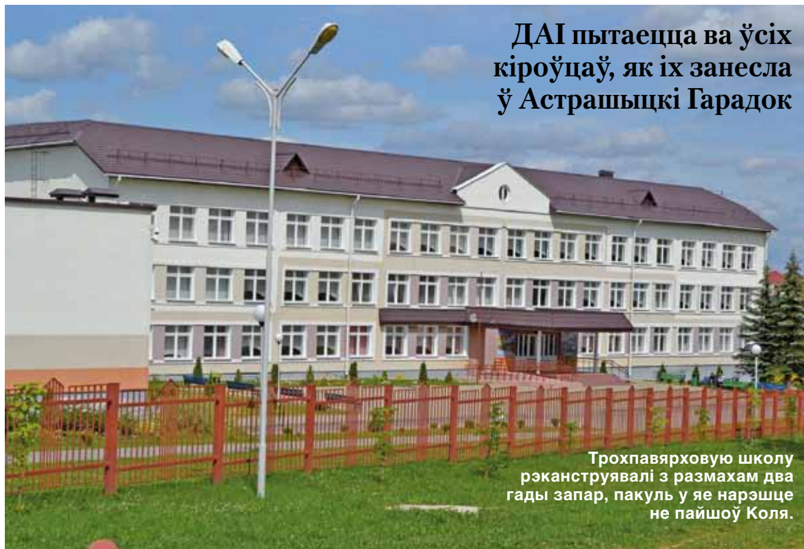
ДАІ пытаецца ва ўсіх кіроўцаў, як іх занесла ў Астрашыцкі Гарадок

Школа адпавядае статусу свайго самага вядомага вучня, таму бацькі не надта хвалююцца пра арганізацыю навучальнага працэсу — усё зроблена на найвышэйшым узроўні. Аднак расказваць пра гэта жыхары Астрашыцкага Гарадка не любяць — ці то пасля настойлівых парадаў на бацькоўскіх сходах, ці то з