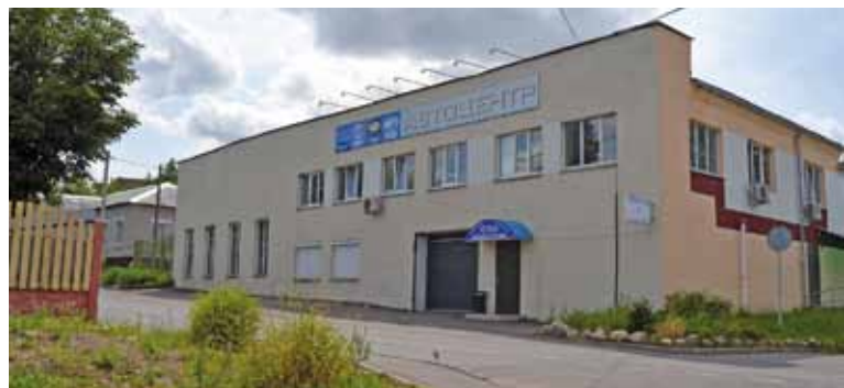
Не кожны аграгарадок можа пахваліцца вялікай СТА. Знаходзіцца ў будынку былой синагогі.