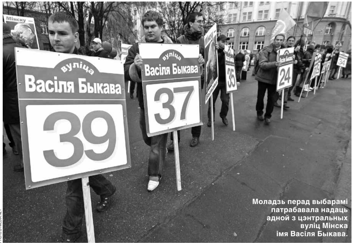
Моладзь перад выбарамі патрабавала надаць адной з цэнтральных вуліц Мінска імя Васіля Быкава.

Так, музей — важны інстытут, што дае ранг і канал камунікацыі з грамадствам.