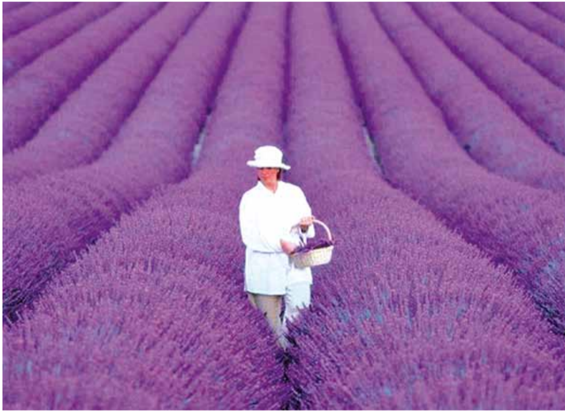
Лавандавыя палі ў Францыі.