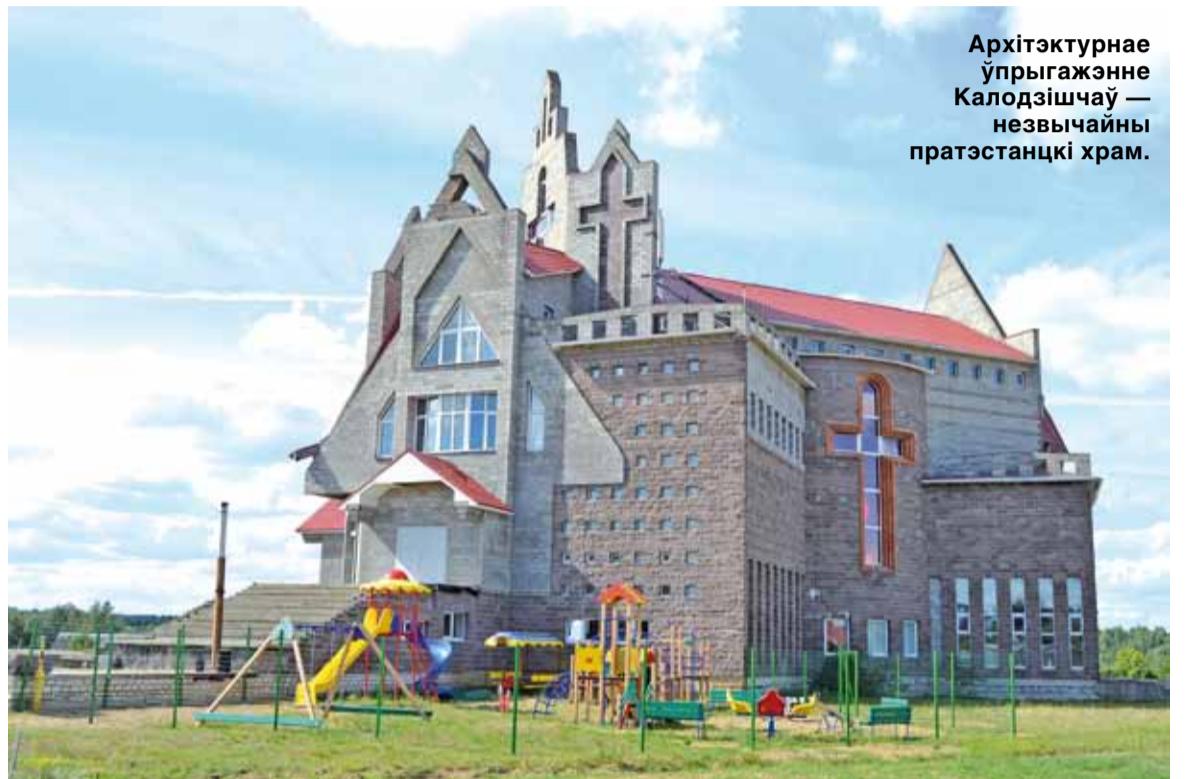
Архітэктурнае ўпрыгажэнне Калодзішчаў — незвычайны пратэстанцкі храм.

Узяць хаця б паліклініку. Непасрэдна ў Калодзішчах мож-