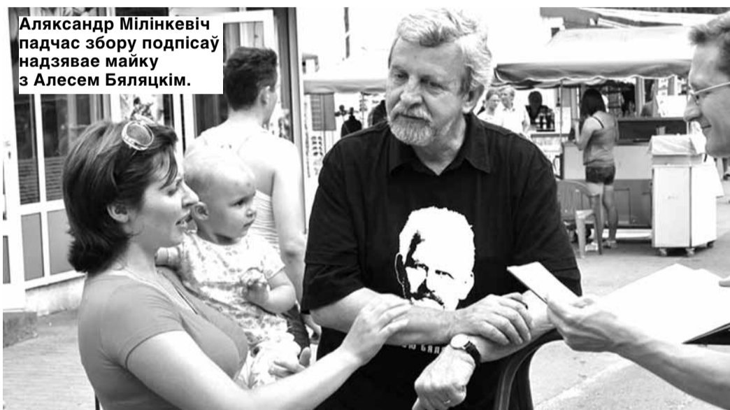
Аляксандр Мілінкевіч падчас збору подпісаў надзявае майку з Алесем Бяляцкім.