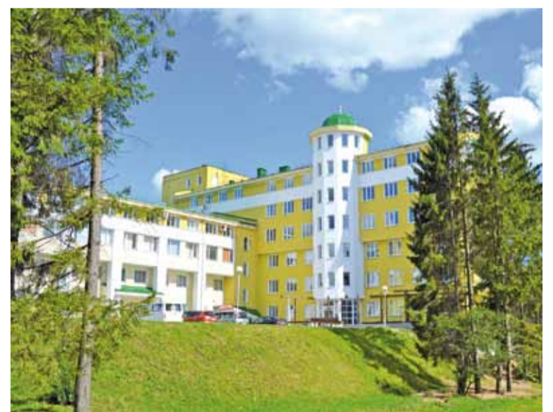
У цэнтры Калодзішчаў — банк і міліцыя.