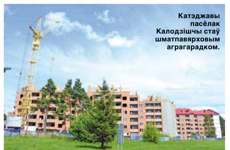
Катэджавы пасёлак Калодзішчы стаў шматпавярховым аграгарадком.

Квадратны метр у калодзішчанскіх навабудах каштуе крыху менш за псіхалагічную мяжу ў тысячу далараў — каля $900—950. Гэта на чвэрць танней, чым у Мінску. А вось дыяпазон цэнаў на гатовыя дамы надзвычай шырокі. Катэджы могуць каштаваць ад $50 тысяч да паўмільёна далараў.