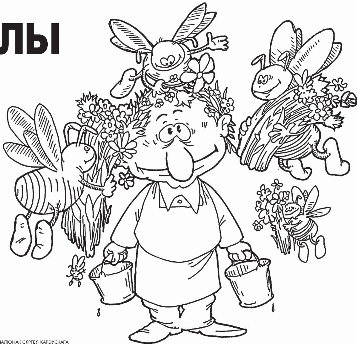
МАЛЮНАК СЯРГЕЯ ХАРЭЎСКАГА

Галоўная ж перавага мёду ў тым, што ён можа захоўвацца некалькі гадоў, бо не акісьляецца: гэта ж ня сала і ня масла. І некаторыя вугляводы акурат падчас захоўваньня набываюць