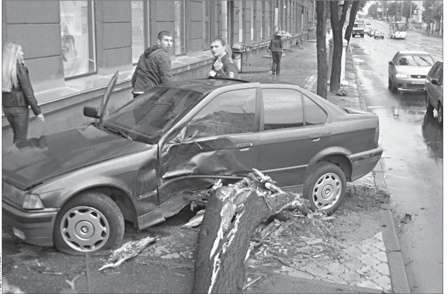
На вуліцы Казлова зьлёны «БМВ» разламаў ліпу, як запалку.