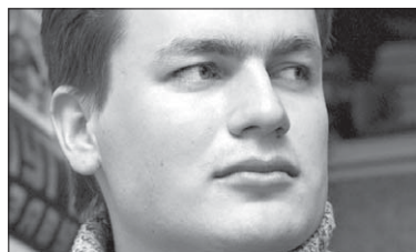
Анатолий Івашчанка — сакратар Саюзу пісьменьнікаў.

На чэзла асьветленай аўтазапраўцы, чакаючы хвілін зь дзесяці касірку («Што, чалавек у туалет схадзіць не можэт?»), назіраю, як чатыры пацаны пад заахвочвальны дзявочы віггат мяцельцаў нейкага таксіста. Вэлкам хоўм.