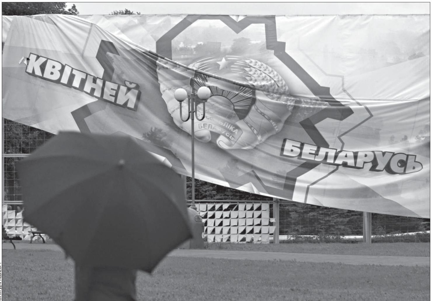
Сарваны ветрам бігборд на праспэктце Машэрава.

разбураныя 50 дамоў, пашкодзаныя каля 200 трансфарматарных падстанцыяў і больш за 500 км лініяў электраперадачы. У населеных пунктах упала ня менш за 1500 вялікіх дрэваў. Самы трагічны выпадак здарыўся каля вёскі Краснаполье на Расоншчыне: апоўначы там забіла сасною грамадзяніна Расеі, які хаваўся ў намёце.