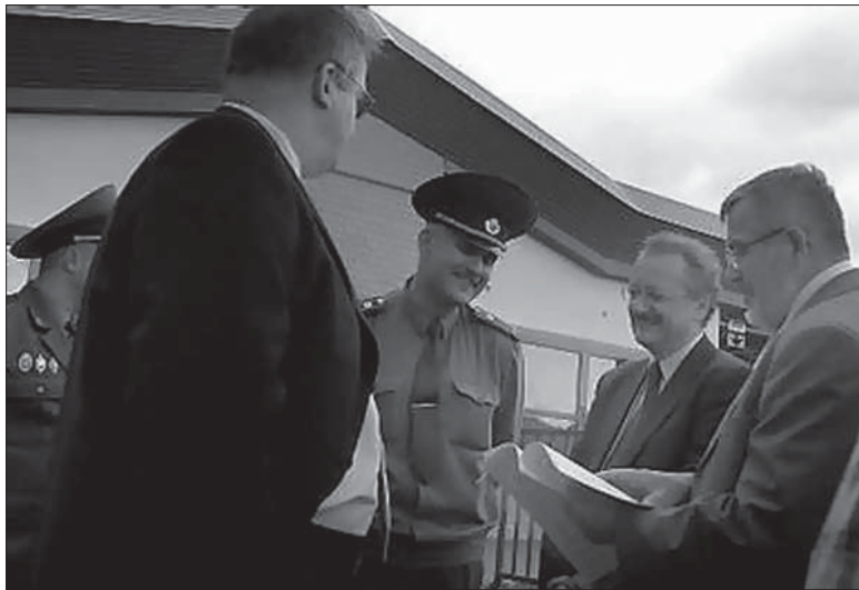
Беларускія памежнікі не прапусьцілі ў Беларусь дэпутатаў Эўрапарлямэнту, якія хацелі наведаць Саюз палякаў.

Вось такая фантастычная вэрсія выдаецца за неабвержную праўду. Маўляў, чытачы «лапухі», усё адно нічога не зразумеюць, тым больш апрацоўку іхнюю ў патрэбным кірунку мэтадычна вядзе «артылерыя буйнога калібру» — БТ ды іншыя «беларускія каналы», а таксама ўся моц дзяржаўнай прэсы кінута на дапамогу — пачынаючы ад слаўтнай «Советской Белоруссии» ды «Во славу родины» да пагалоўна ўсіх абласных і раённых газетак. Але гэта, маўляў, ніякая не палітыка, гэта