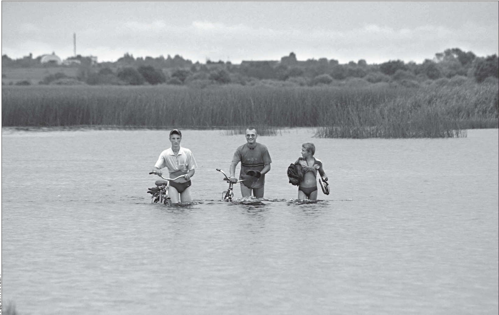
Брод на возеры Сялява, што за Халопенічамі. Апошнія дні летняга турызму.