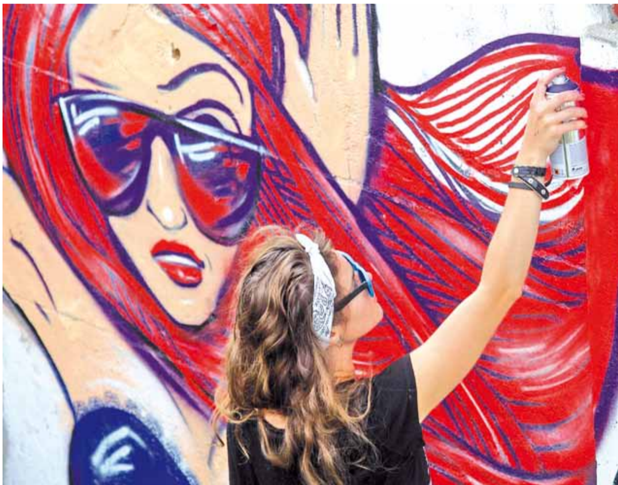
Хостал Jazz правёў мерапрыемства «Жывы беларускі стрыт-арт», у рамках якога графіцісты размалявалі плот і кухню хостала.

*** Прэм'ер Расіі Мядзведзеў так і не зразумеў, чаму ў Мінску яго ніхто не фатаграфавалі. Усе фатаграфы адварочваліся і пераходзілі на іншы бок вуліцы. *** Мядзведзеў, рукі прэч ад цырка! Лепш «Беларуськалі!» *** На фэйс-кантролі звычайна стаяць людзі, якія самі яго ніколі не пройдуць. *** — У нас у гасцях заслужаны морж Беларусі. Раскажыце, як вы ўпершыню апынуліся ў палонцы? — Гэтак жа, як і ўсе: вырашыў скараціць шлях. *** Страўс-клаўстрафоб больш за ўсё ў жыцці баіцца спалохацца. *** — Кручуся, як дура ў коле! — Вавёрка. — Не, у вавёркі хоць футра ёсць, а я дура. *** — А вось памятаю, у нас у дзіцячым садку таксама хлопец адзін быў. Усіх біў. Апроч мяне. Я моцны быў, заўсёды даваў адпор. За гэта мяне і выгналі з садка. — ??? — Сказалі, што вартаўнік не павінен з дзецьмі біцца. *** Ведаю цудоўны жарт пра пошту, але ён не да ўсіх даходзіць.