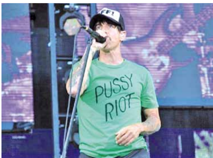
Red Hot Chili Peppers, выступаючы на радзіме Пуціна, падтрымалі Pussy Riot, групу, што зладзіла ў храме Хрыста Збаўцы панк-малебен «Багародзіца, Пуціна прагані!». Дзяўчатам якраз у пятніцу працягнулі арышт на паўгода.