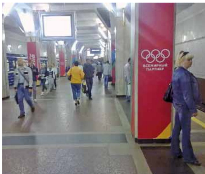
Станцыю метро «Плошча Перамогі» ўпрыгожылі «алімпійскай» рэкламай.