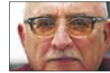
Камертон Сяргея Ваганова