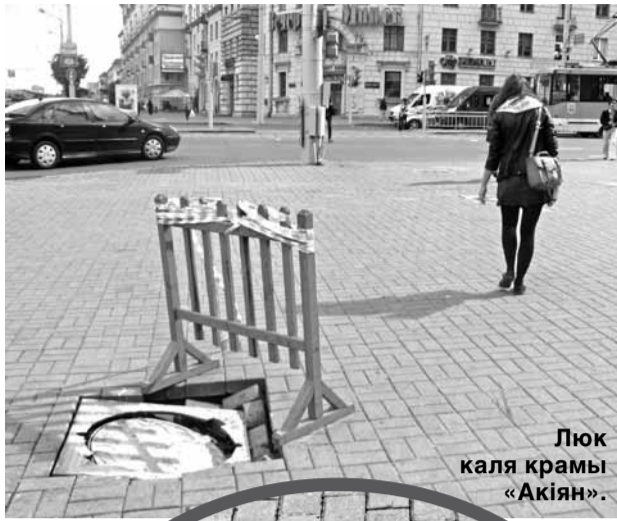
Люк каля крамы «Акцян».