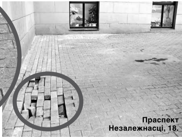
Проспект Незалежнасці, 18.