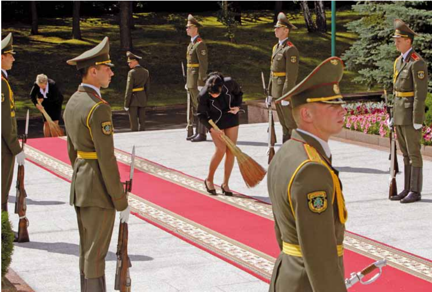
Перад Адміністрацыяй прэзідэнта ў чаканні Дзмітрыя Мядзведзева. Болей пра візіт — старонка 3.