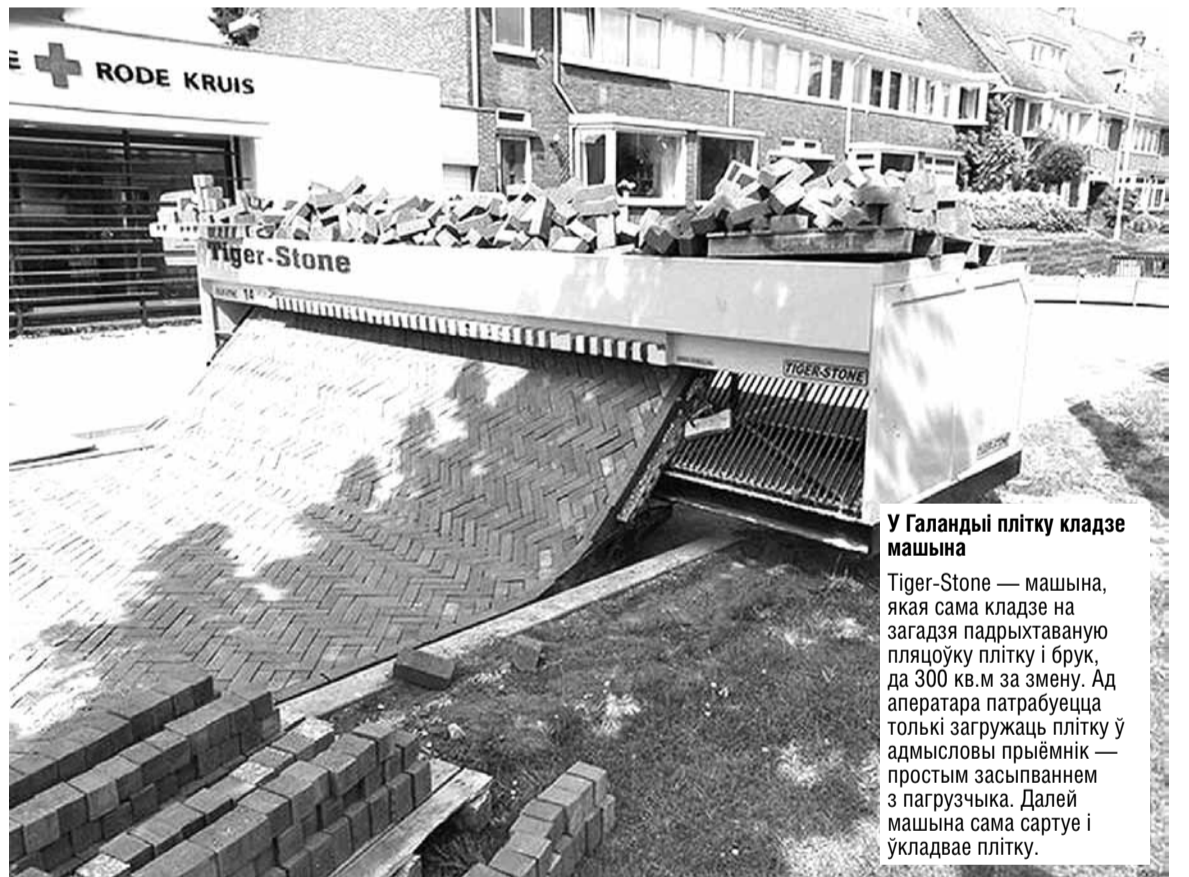
У Галандыі плітку кладзе машына

Tiger-Stone — машына, якая сама кладзе на загадзя падрыхтаваную пляцоўку плітку і брук, да 300 кв.м за змену. Ад аператара патрабуюцца толькі загрузчыя плітку ў адмысловы прыёмнік — простым засыпаннем з пагрузчыка. Далей машына сама сартуе і укладвае плітку.