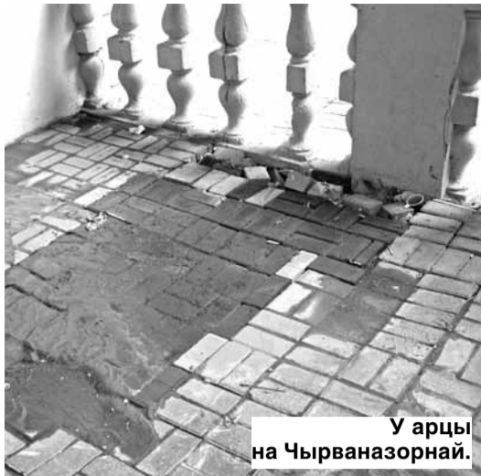
У арцы на Чырваназорнай.