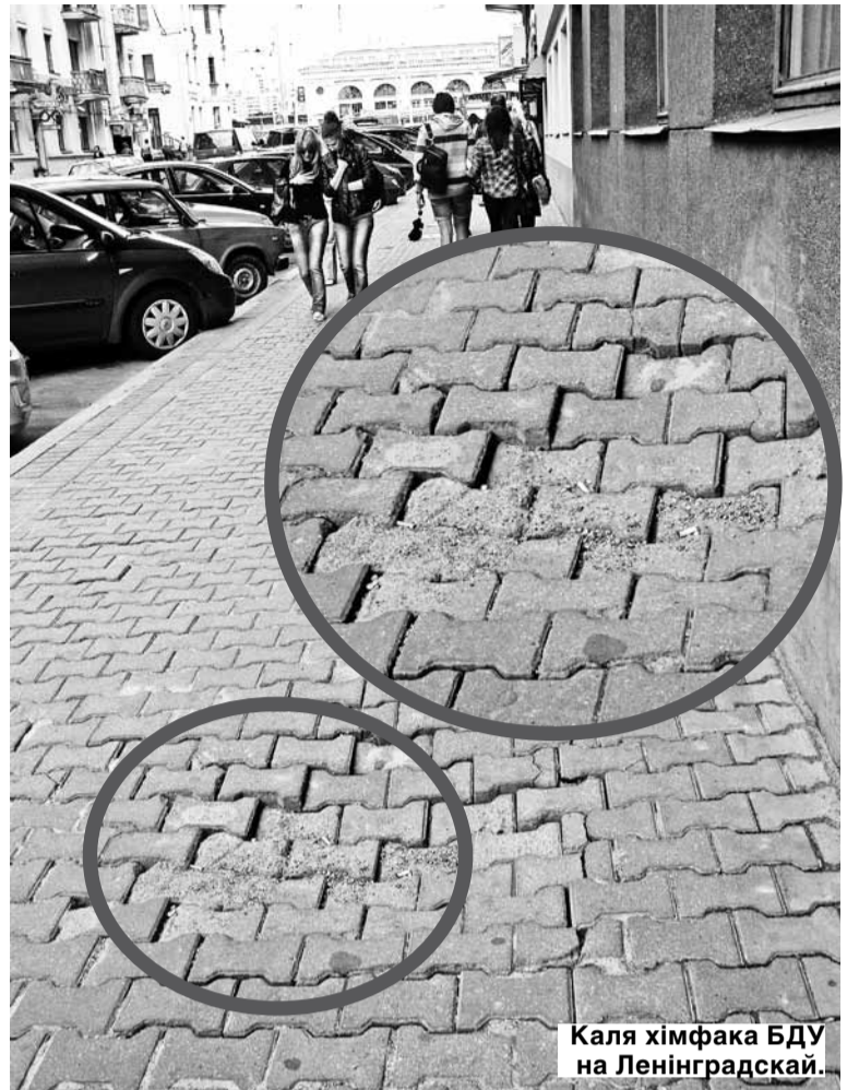
Каля хімназіі БДУ на Ленінградскай.