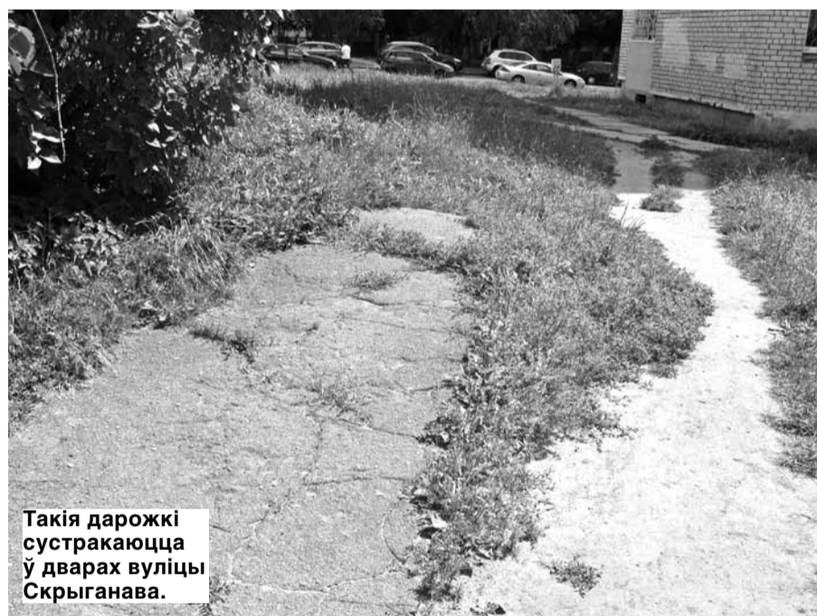
Такія дарожкі сустракаюцца ў дварах вуліцы Скрыганава.