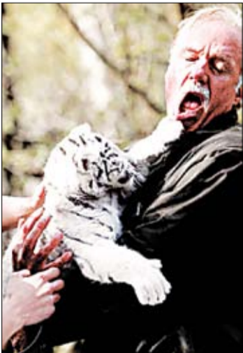
Тыгрыная пшчота. Белая тыгрная з нямецкага запарка вырашыла паглядзіць свайго ветэрынара.