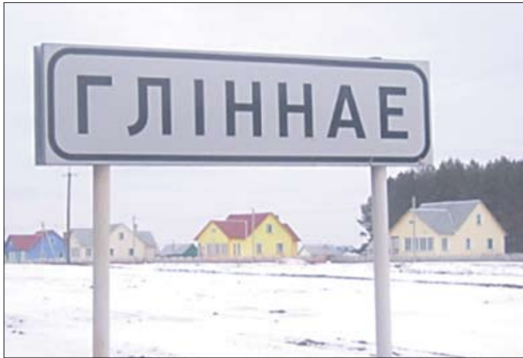
З боку Докшыцаў Гліннае выглядае ў найлепшых традыцыях афіцыйнай прапаганды.