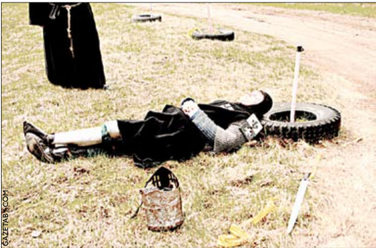
Выходнымі ў Сілічах прайшоў Грунвальдскі фэст.