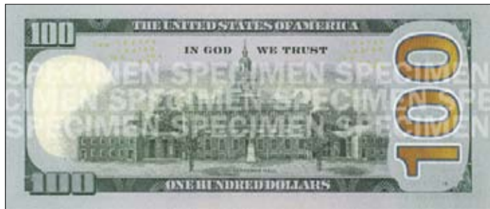
Даляр перастае быць зялёным: так выглядае абноўленая стодаларавая купюра, якая хутка з'явіцца ў абарачэнні. Банкнота захоўвае традыцыйны выгляд, але мае некалькі істотных адрозненняў. Сотня стала больш «каляровай», чым цяперашняя. На прырэдным баку справа ад партрэта Франкліна з'явілася ахоўная паласа з галаграфічнымі выявамі. На купюры маецца выява звана, на яким, калі прыгледзіцца, можна пабачыць ахоўныя знакі.