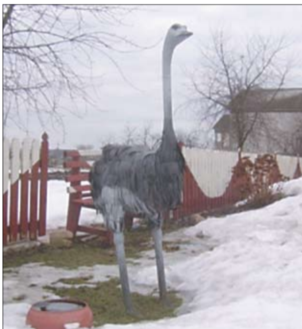
Вяскоўцы, кожны на свой лад, упрыгожваюць падворкі. У кагосьці можна убачыць страуса.