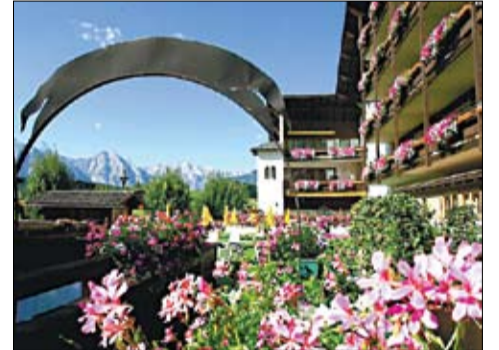
...дзе спыняўся Лукашэнка.