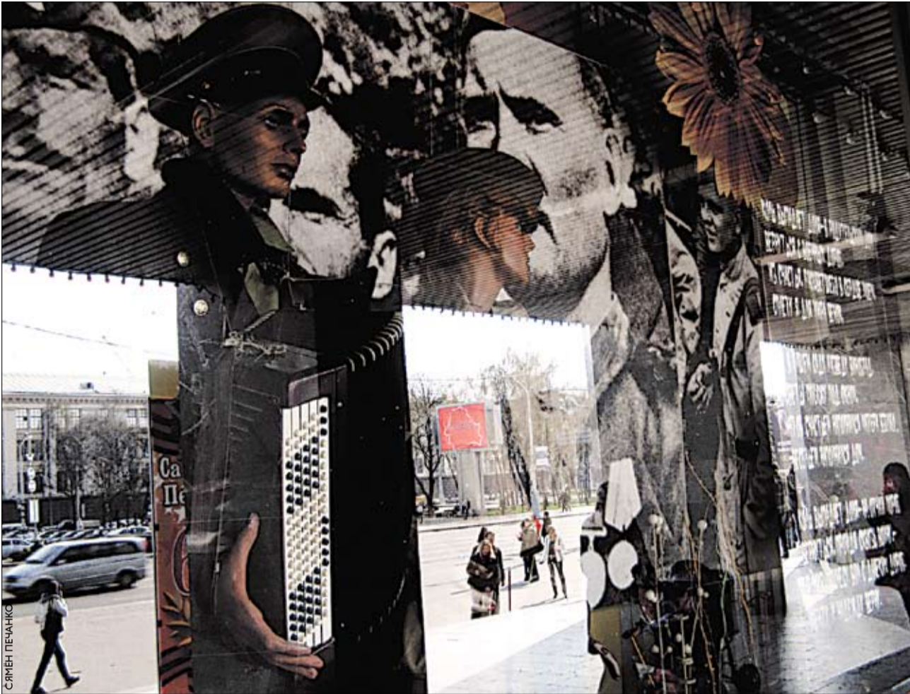
Пасля загаду ўпрыгожыць мінскія крамы да 9 Мая ў вітрынах з'явіліся манекены-ветэраны.