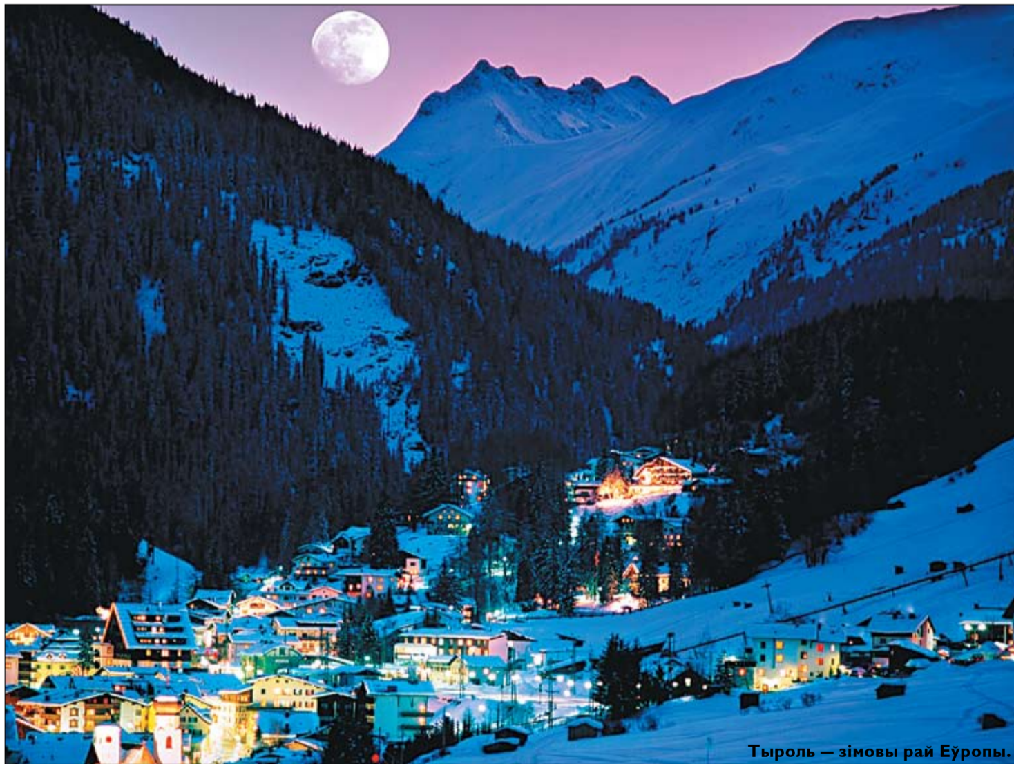
Тыроль — зімовы рай Еўропы.