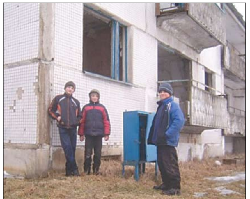
На развалінах дзеці гуляюць у квача.