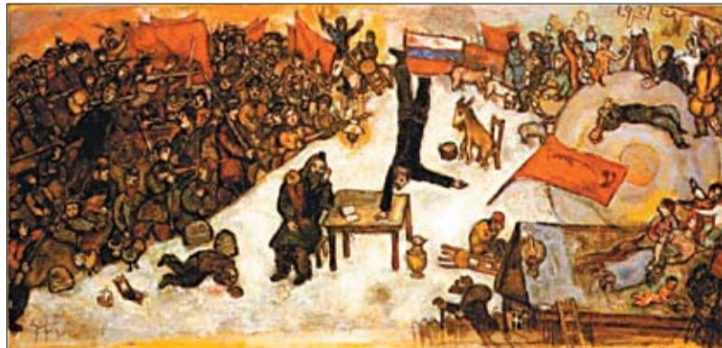
Карціна Марка Шагала «Рэвалюцыя» (1968), якая раней ніколі не экспанавалася, стане топ-лотам таргоў жывалісам імпрэсіянізму і мадэрнізму на аукцыёне Bonhams. Таргі пройдуць 22 чэрвеня ў Лондане. Шагал любіў карціну і захоўваў яе ў сябе дома. Палатно ацанілі ў 1,2—1,8 млн фунтаў.