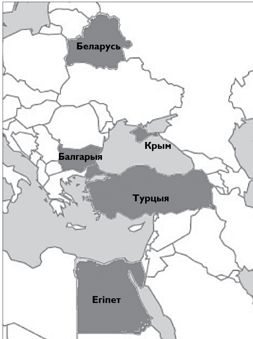
Краіны, у якія выязджалі беларускія турысты ў 2009*

Куды паехаць? Паводле падлікаў Белстата, айчыныя турысты найчасцей абіраюць Крым. І хоць яго папулярнасць падае з кожным годам, Украіна ўтрымлівае за сабой траціну турыстычнага рынку. Турцыя з Егіптам маюць на дваіх яшчэ столькі ж турыстаў. Балгарскі варыянт абагнаў расійскі, які становіцца ўсё менш папулярным. Для параўнання, за 2009 год у Беларусь прыехала на адпачынак 56 тысяч расіян. А вось у адваротны бок — усяго 22 тысячы беларусаў. Якія плюсы і мінусы мае кожны з накірункаў адпачынку?