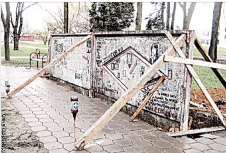
«Сцяну Віктара Цоя» — два фрагменты бетоннай будаўнічай агароджы, спісанай графіці і вершамі прыхільнікаў культувага расійскага спевака, — усталявалі ў скверы на перасячэнні вуліц Беларускай і Ульянаўскай, недалёк ад стадыёна «Дынама». Паспрыялі гэтаму фанаты творчасці Цоя, якія перадалі ў Мінгарвыканкам каля 2000 подпісаў.