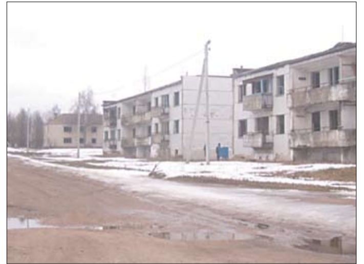
А гэта частка Гліннага больш нагадвае закінутыя паселішчы Чарнобыльскай зоны.